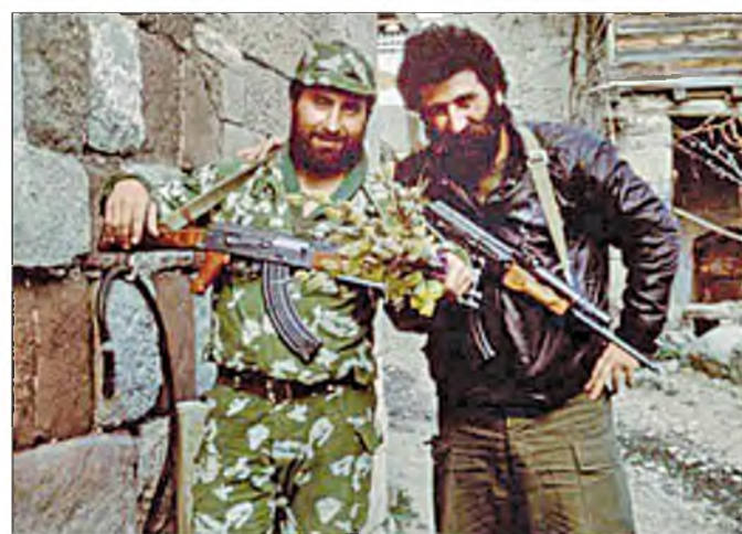
С боевым товарищем в Геташене, 1991 г.