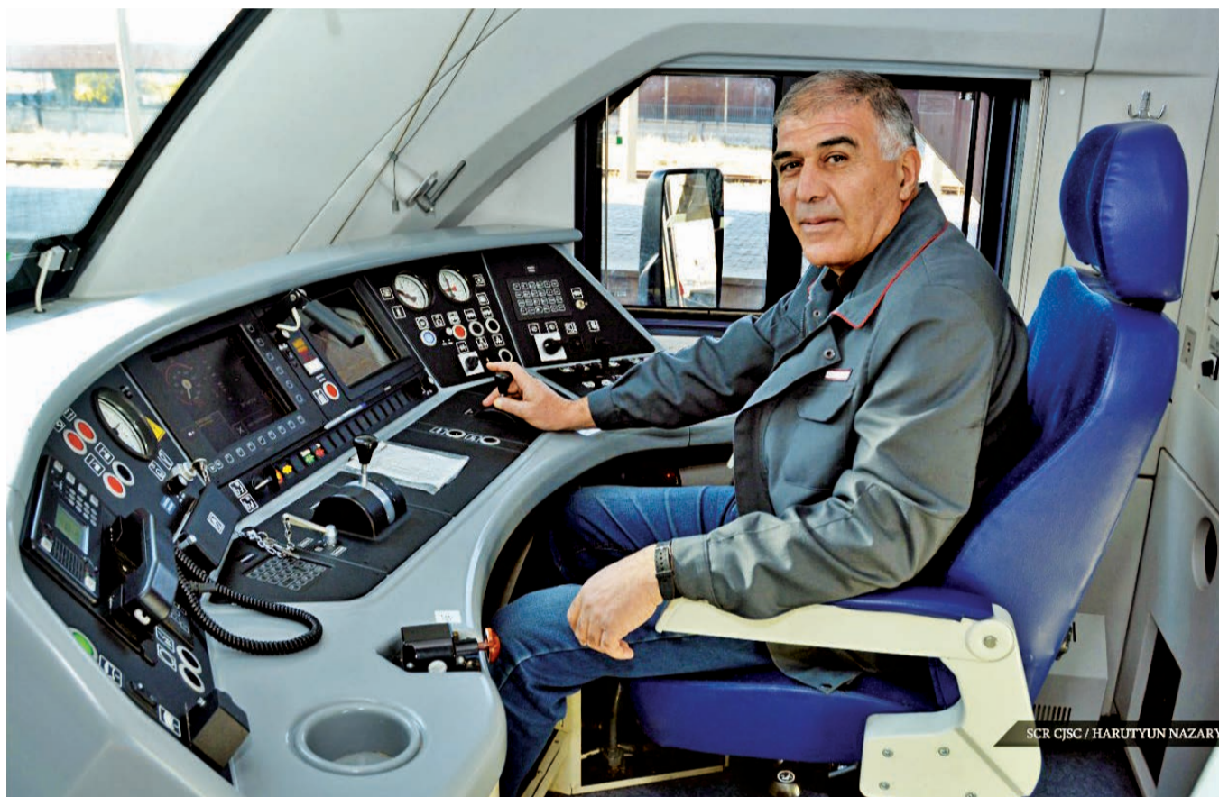
SCR CJSC / HARUTYUN NAZARY

Времени на разговор оставалось мало, нам нужно было сходить на станции в Армавире, поэтому в конце разговора я успела спросить у машиниста